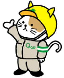
Q-CATマスコットキャラクター Q太くん

自動付帯の保険制度であるため、工事ごとの保証書は発行されません。事故発生時に、認定品の適切な使用が確認された場合に保険金が支払われます。